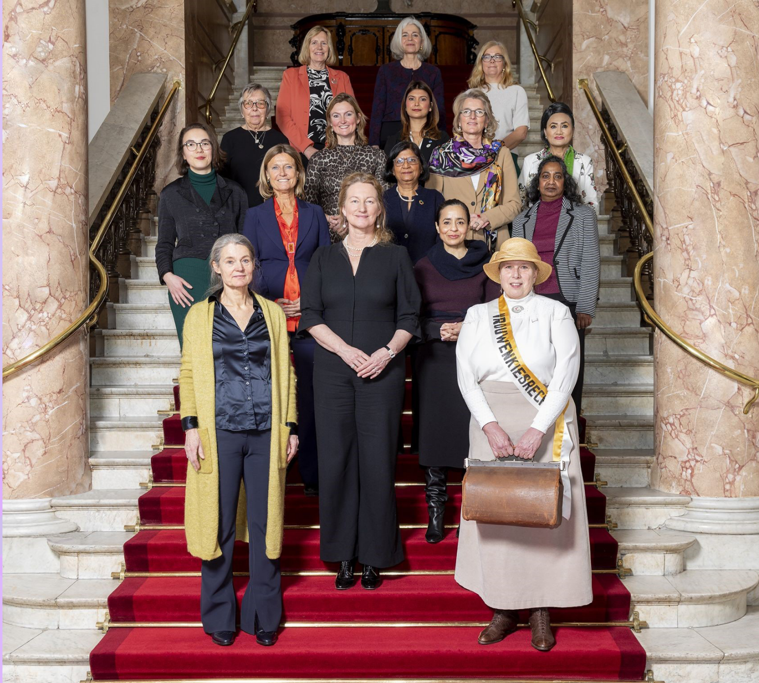
In afwachting van de Nieuwjaarsreceptie poseren leden van bestuur, staf en enkele sprekers in de Estafette-speech op de trap van Sociëteit De Witte