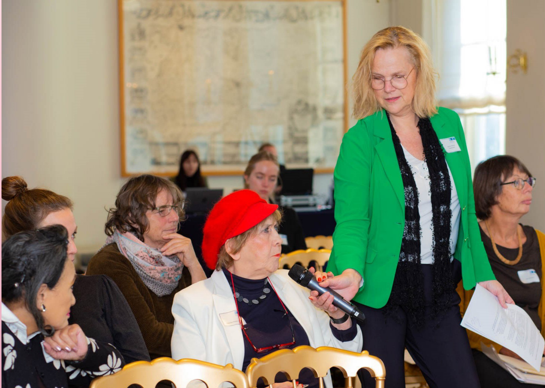
Slotbijeenkomst FEM Talks: Naar een duurzame, feministische economie (01-12-2022)