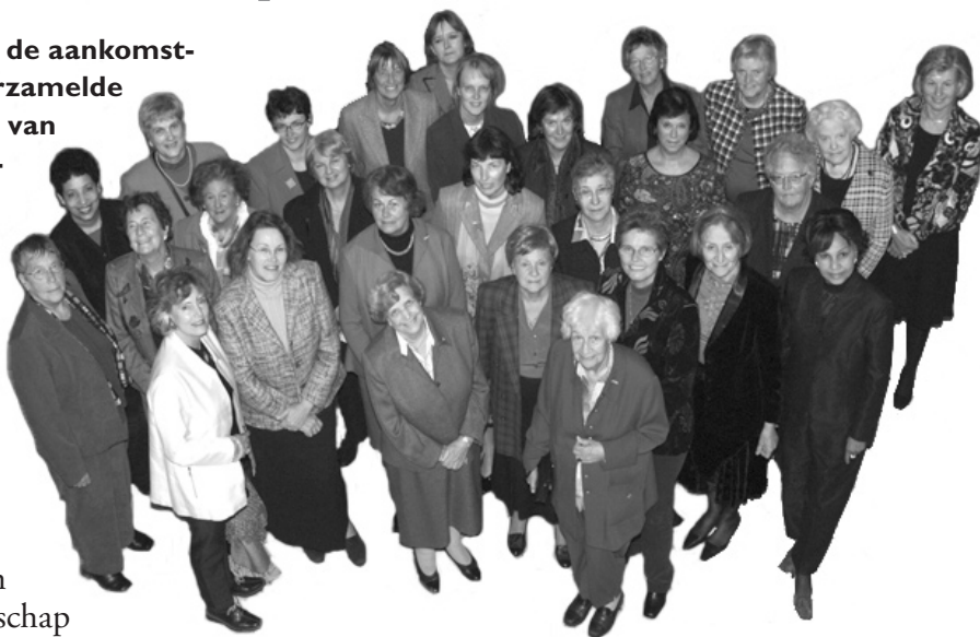
Aanwezige vrouwenvertegenwoordigers naar AVVN en andere internationale vergaderingen.

Met veel geamuseerde herkenning, maar soms ook wat meewarig, volgden de ervaren ambassadeurs en vertegenwoordigers de voordrachten. Ondanks de verstreken jaren lijken doelstellingen als het afrekenen met armoede en gelijke kansen (met name voor vrouwen!) onveranderd van kracht. "De markt is genderblind" constateert minister van Ardenne. In de globalisatie ziet zij nieuwe kansen: "Nationale overheden kunnen steeds minder doen. Overheden moeten partnerships aangaan met de lokale bevolking." Met enkele schrijnende cijfers toonde zij haar besef van de problematiek: elke minuut sterft ergens in de wereld een vrouw tijdens de bevalling en drie van de vier mensen met HIV is vrouw, waarvan 90% geen enkel idee heeft van wat dat betekent.